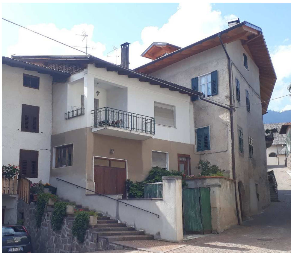
Vista da est