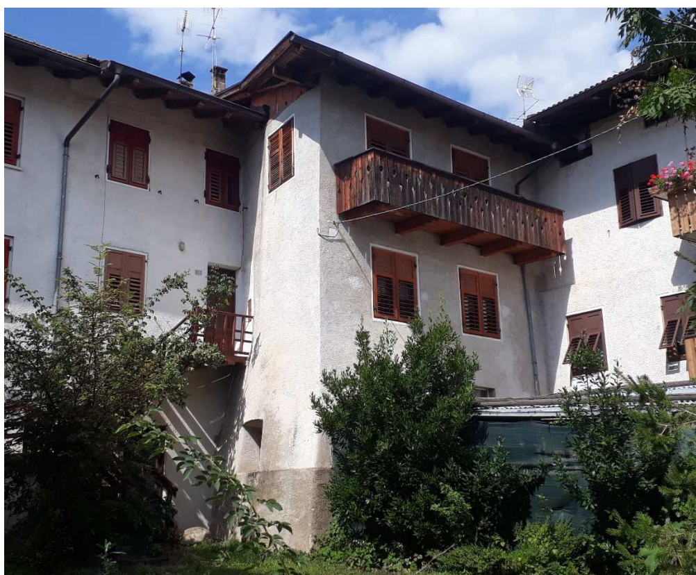
Vista da sud